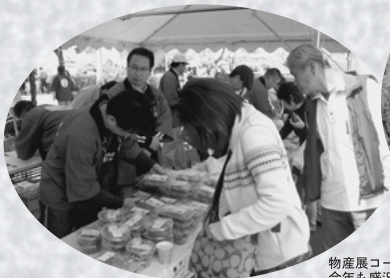
物産展コーナーは今年も盛況でした

今年の来客数は、土曜日が約3,000人、日曜日は約8,500人のお客さんが下北山のさくらを満喫されました。