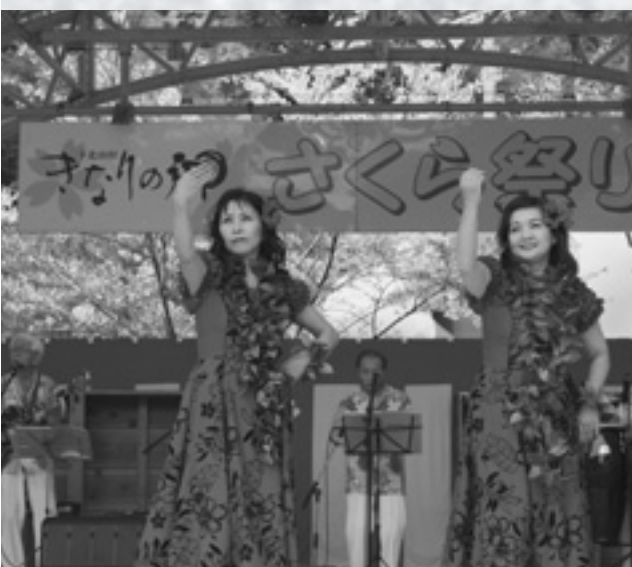
気分はハワイアン