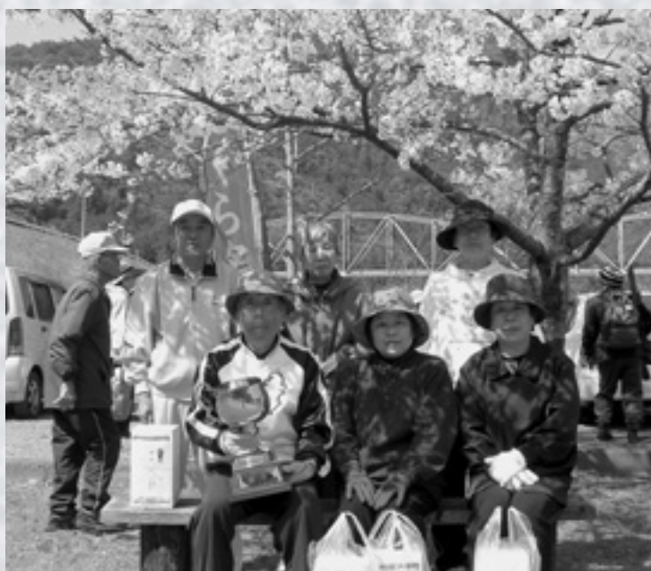
ゲートボール大会で見事優勝した古道チーム（御浜町）