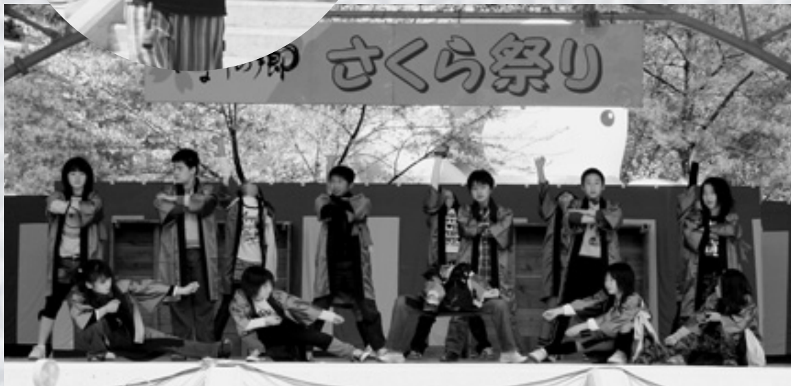
地元小学生による南中ソーラン