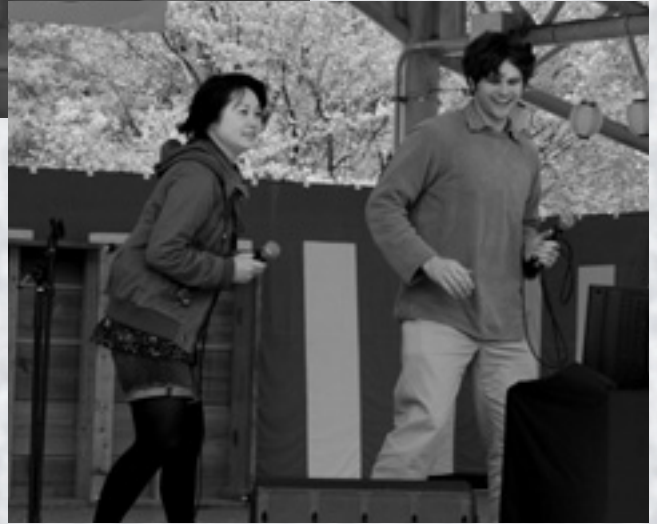
多くの方々が目撃ののどを披露しました